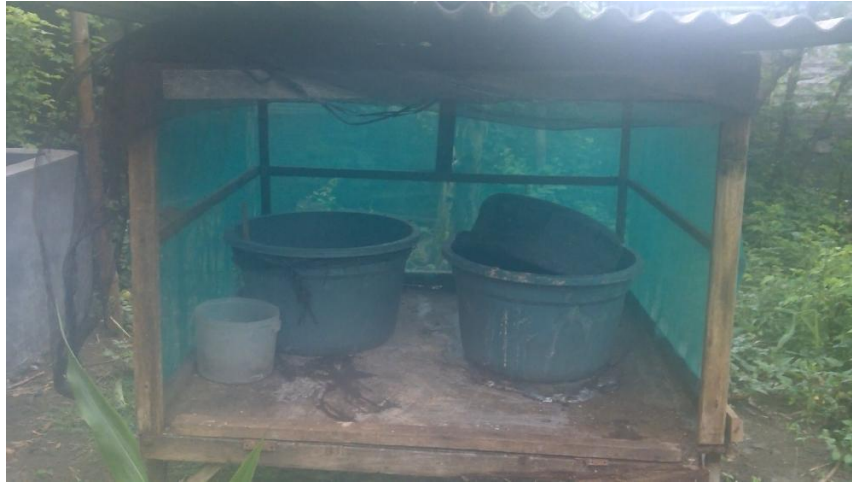
Gambar 4. Tempat budidaya maggot