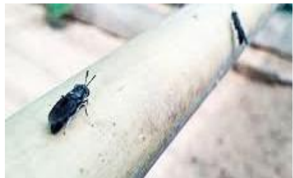
Gambar 5. Lalat black soldier ( Hermetia illucens )

Gambar 5 menunjukkan lalat yang berada di dalam tempat budidaya. Sebelum bertelur, lalat betina akan mencari tempat yang sesuai dan aman untuk meletakkan telurnya. Lokasi yang dipilih untuk bertelur umumnya berdekatan dengan sumber makanan media pertumbuhan, dalam budidaya maggot tempat bertelur lalat adalah daun pisang kering yang diletakkan diatas media budidaya. Lalat betina akan meletakkan telur pada hari kedua setelah kawin, telur akan menetas menjadi larva dalam waktu tiga sampai empat hari. Larva instar pertama akan berkembang sampai menjadi instar keenam dalam waktu 22–24 hari dengan rata-rata 18 hari (Barros-Cordeiro, Bao, & Pujol-Luz, 2014).