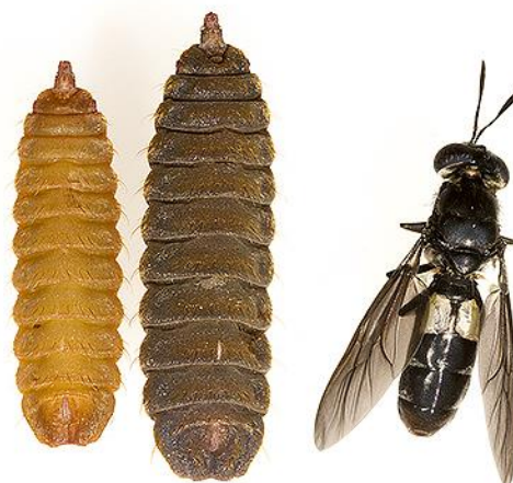
Gambar 2. Morfologi larva, pupa dan lalat dewasa black soldier ( Hermetia illucens ) (McShaffrey, 2013)

Diener, Zurbrügg, dan Tockner (2009) telah menyebutkan beberapa keunggulan dari Maggot lalat black soldier . Maggot lalat black soldier memiliki tekstur yang kenyal dan memiliki kemampuan untuk menghasilkan enzim alami yang dapat meningkatkan kemampuan daya cerna ikan terhadap pakan. Maggot lalat black soldier adalah sumber protein yang dapat menjadi alternatif pakan ikan. Bahan yang mengandung protein kasar lebih dari 19% dianggap sebagai bahan sumber protein yang baik Murtidjo (2001). Ogunji, Nimptsch, Wiegand, dan Schulz (2007) menyatakan sebesar 30% tepung ikan yang digunakan untuk pakan dapat digantikan oleh