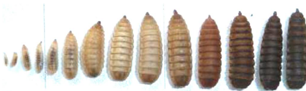
Gambar 5. Perubahan ukuran larva (Fahmi, 2015)

Proses panen budidaya maggot dilakukan minimal setelah dua minggu masa budidaya maggot. Pada waktu 2 minggu telur lalat black soldier sudah menetas dan memasuki fase larva instar kedua yang tumbuh sekitar 10 mm sebelum melepaskan kulit menjadi larva instar ketiga. Larva instar ketiga tumbuh antara 15 mm dan 20 mm sebelum berada pada fase pre-pupa. Budidaya yang dilakukan dengan 100 kg bahan baku media kultur, dapat menghasilkan larva sebanyak 60 -70 kg. Perlu diingat daur hidup maggot sebelum menjadi lalat selama 37 hari. Jadi untuk pakan